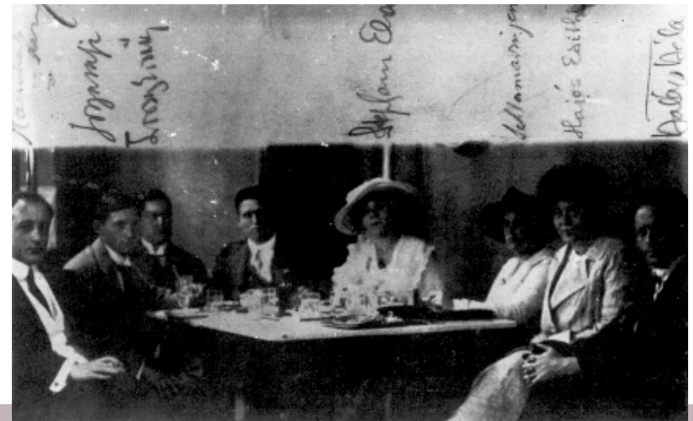
v.l.n.r.: Mannheim Károly, Fogarasi Jenő, Lorsy Ernő, Nemes Lampérth József, Stephani Elsa, Schlamadinger Anna, Hajós Edit, Balázs Béla (vor 1919)