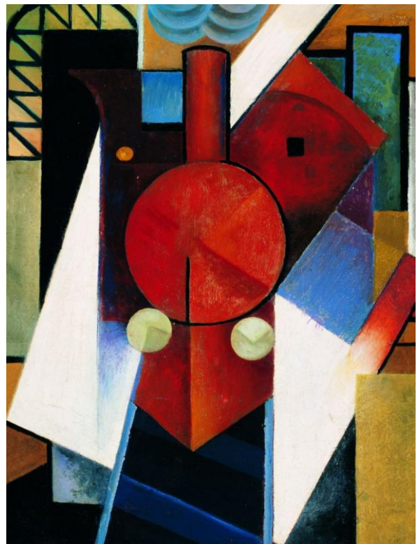
Bortnyik Sándor: Vörös mozdony (1918)

Bortnyik Sándor (1893 - 1976) festő, grafikus, az aktivisták mozgalmának kiemelkedő tehetségű tagja volt. 1918-ban csatlakozott a Kassák-körhöz, részt vett a Ma kollektív kiállításán. Később a folyóirat rendszeresen közölte grafikáit, és még 1920 után is a Ma munkatársa maradt, amikor Bécsbe emigrált. Hazatérte után (1925), 1928—1938-ban Műhely néven grafikai magániskolát nyitott, ahol a Bauhaus elvei szerint tanított. 1949 és 1956 között a Magyar Képzőművészeti Főiskola igazgatója volt.