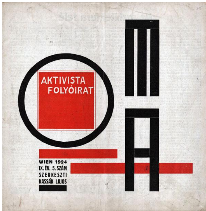
A "Ma" borítója (Wien, 1924, 5. szám)

Avantgárd (a francia "avant-garde", "előrs" katonai műszóból) mindazon képzőművészeti és irodalmi irányzatok neve, melyek a 20. század elején jelentkezték, s melyek alapvetően megváltoztatták a művészetről alkotott képet, illetve magát a művészetet. A fejlett nyugati országok társadalmi válsága a 19. század végére felerősödött. Ezt a képzőművészetben azonnal jelezte a szociális érzékenységgű témák megjelenése, és több új irányzat kialakulása. Az avantgárd törekvések rövid ideig tartó, forradalmi lendületű mozgalmakat hoztak létre.