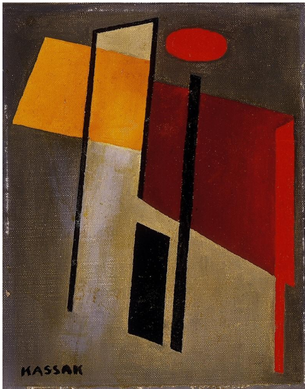
Kassák Lajos: Kompozíció

Az 1910-es évtized végére Kassák műhelyében már kialakult az expresszionizusból és még inkább a konstruktivizusból elkülönülő aktivizmus. Ebben az irányzatban a társadalmi és technikai haladás eszméi szólaltak meg, a népköltészet és a városi műdal stíluselemeit is befogadva. Az aktivizmus alapelve szerint a művészet: tett. Ez az irányzat a világot technicista látószögből szemléli. A művész a társadalom vezére, "kollektív individuum", a romantikus vátesz modern utóda. Az aktivista stílus: didaktikus, színpadias, agitatív.